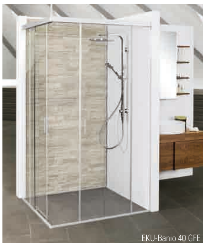
EKU-Banio 40 GFE

Moderne Badezimmer sind Orte des Wohlfühlens und der Entspannung. Das Bad ist zum selbstverständlichen Bestandteil eines behaglich gestalteten Wohnraums geworden. Die Ansprüche an Ausstattung und Technik sind entsprechend hoch. Gefragt sind individuelle, niveauvolle Lösungen. Dazu gehören massgeschneiderte Badmöbel und Ganzglasduschen. EKU hat die dazu passende Technik. Elegant gleitende Schiebetüren für wandmontierte Designerduschen, die sowohl für Nischen (EKU-Banio 40 GF) als auch für Raumecken (EKU-Banio 40 GFE) geeignet sind. Der Einbau ist denkbar einfach: Die bequem in der gewünschten Grösse zuschneidbaren Schienen, Blenden und Schwellen machen EKU-Banio zu einem montagefreundlichen Ganzen im aufstrebenden