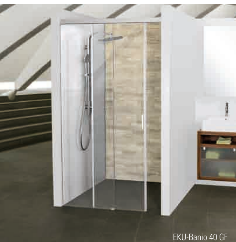
EKU-Banio 40 GF