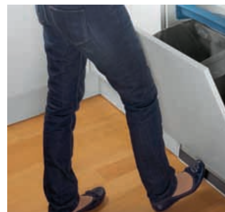
► Fusspedal (optional)

Optimaler Zugriff auf Eimer, Utensilien und Kleinbehälter sowie komfortables wechseln des Abfallsacks.