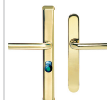
► PVD-beschichtet, ähnlich wie Messing