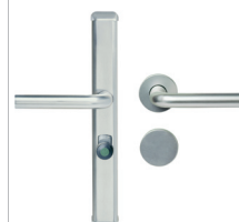
► Aluminium F1, naturfarbig eloxiert